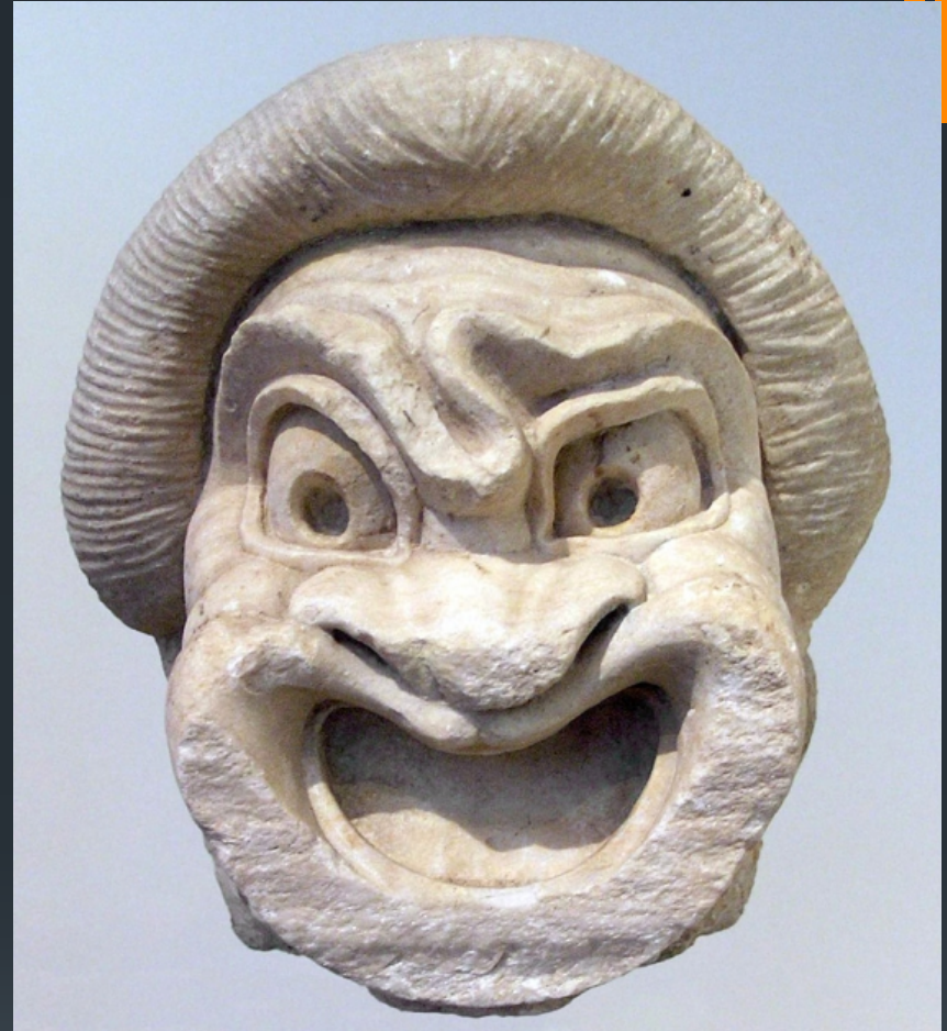
Театральная комедийная маска, II в. до н.э., Афины.

Комическое (от др.-греч. κωμῳδία, лат. comedia ) — философская категория, обозначающая культурно оформленное, социально и эстетически значимое смешное. Хотя традиционно категория комического употребляется в эстетике по отношению к искусству, ее смысл гораздо шире. Она может применяться как общефилософская категория по отношению к социальным процессам, истории, жизни в целом.